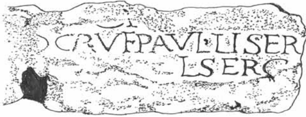
Inscripción de L. Sergius Paulus Museo Yalvac, Pisidia, Antioquía

El escritor romano Plinio el Anciano hace referencia a "Sergius Paulus" que usó como fuente de información así como otros el Libro 2 y el 18 de su obra sobre "Historia Natural." Resulta también interesante fijarse en que Plinio menciona que la Isla de Chipre fue invadida por aquellos que practicaban la brujería al igual que en el caso de Elimas, acerca del cual dice la Biblia que intentó engañar a Sergius Paulus. Plinio dice: "Existían diferentes grupos de magos desde los tiempos de Moisés, como Janes y Laotape, acerca de los cuales los judíos habían hablado y de hecho, son miles los que todos los años siguen las costumbres de Zoroastro durante los tiempos recientes en la Isla de Chipre."