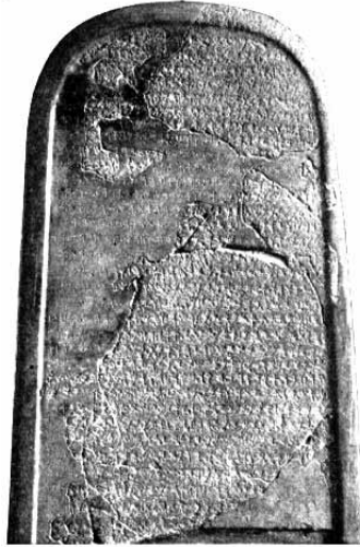
Lapida De Mesa

En 1868 se descubrió una lápida en la ciudad bíblica de Dibon, sobre la cual habían escrito las victorias sobre los israelitas del rey Mesa de Moab.